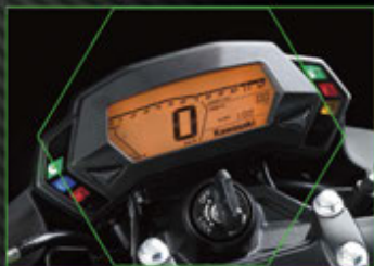
Instrumentasi all-digital sporty