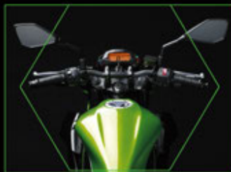
Setang lebar & rata: mendukung tampilan & gaya berkendara yang agresif