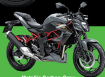
Metallic Carbon Grey