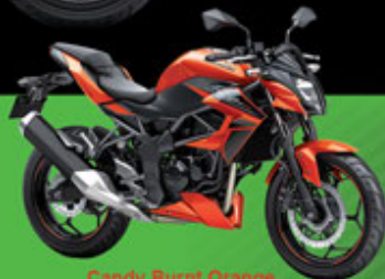
Candy Burnt Orange